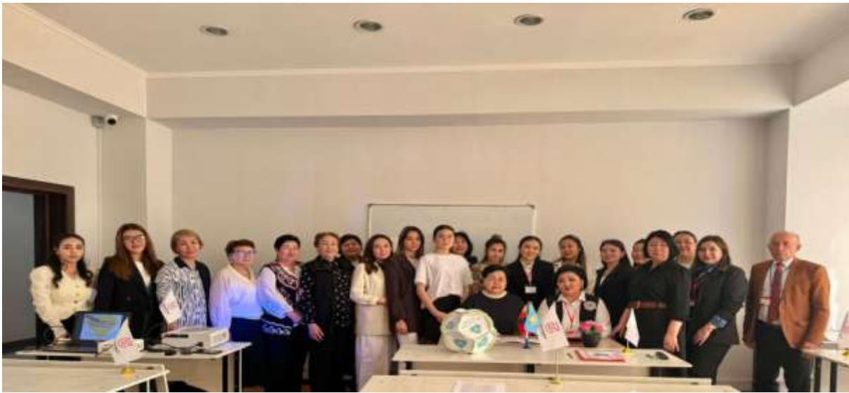
Іскерлік ойын: «Мен қандай көшбасшымын?» Мақсаты – көшбасшылық туралы білімдерін кеңейту; ұжыммен қарым-қатынаста жағымды және жағымсыз қасиеттерді білу