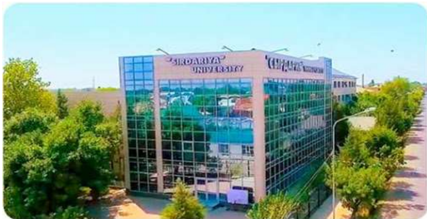
СЫРДАРИЯ” УНИВЕРСИТЕТІНІҢ БАС ОҚУ ҒИМАРАТЫ