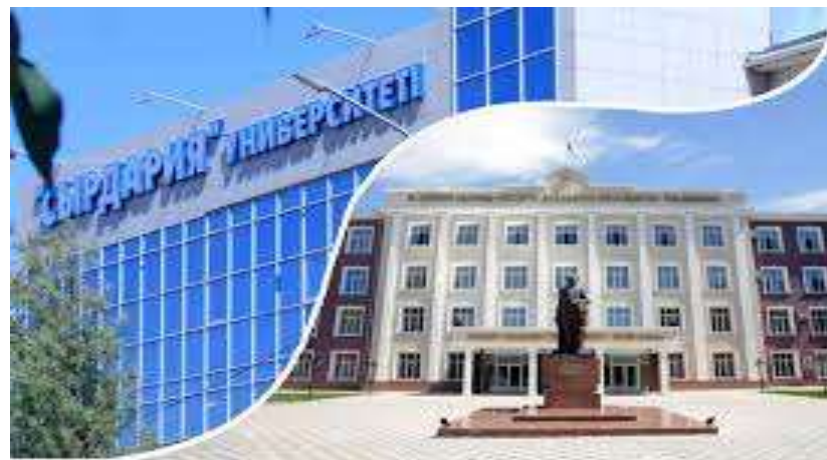
М.ӘУЕЗОВ АТЫНДАҒЫ ОҚМУ