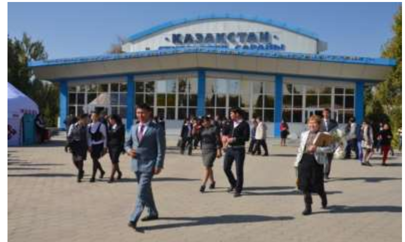
«Қазақстан» студенттер сарайы