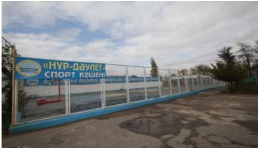
«Нұр-Дәулет» спорт кешені