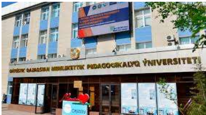
ОҢТҮСТІК ҚАЗАҚСТАН МЕМЛЕКЕТТІК ПЕДАГОГИКАЛЫҚ УНИВЕРСИТЕТІ