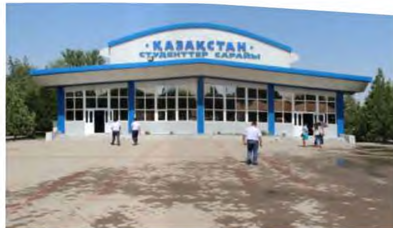
«Қазақстан» студенттер сарайы