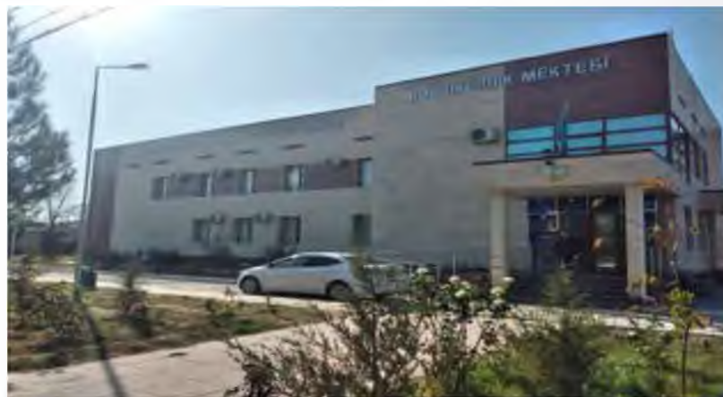
ЖЕТІСАЙ АУДАНЫНЫҢ КӘСІПКЕРЛІК БӨЛІМІ