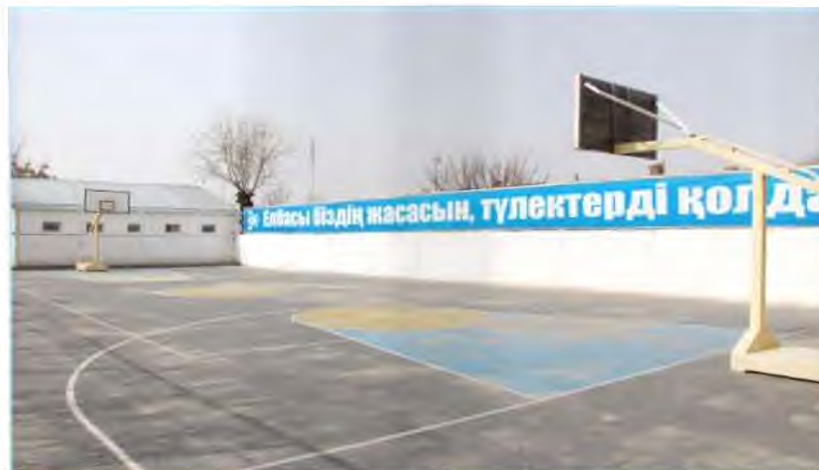
«Нұр-Дәулет» спорт кешені