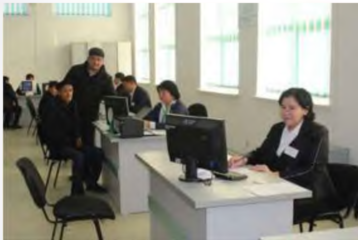
ЖЕТІСАЙ АУДАНДЫҚ ХАЛЫҚҚА ҚЫЗМЕТ КӨРСЕТУ ОРТАЛЫҒЫ