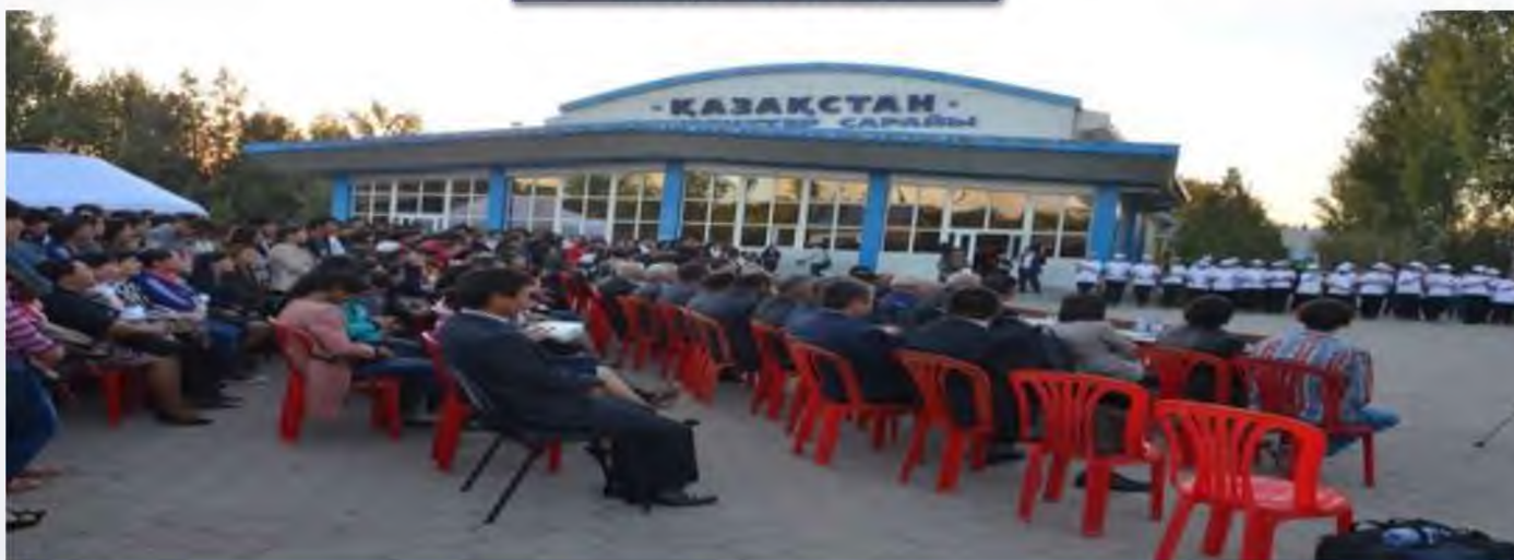
«ҚАЗАҚСТАН» СТУДЕНТТЕР САРАЙЫ