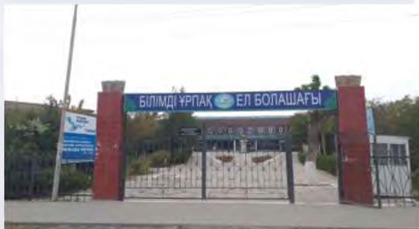
"ҒАНИ МҰРАТБАЕВ АТЫНДАҒЫ ЖЕТІСАЙ ГУМАНИТАРЛЫҚ-ТЕХНИКАЛЫҚ КОЛЛЕДЖІ"