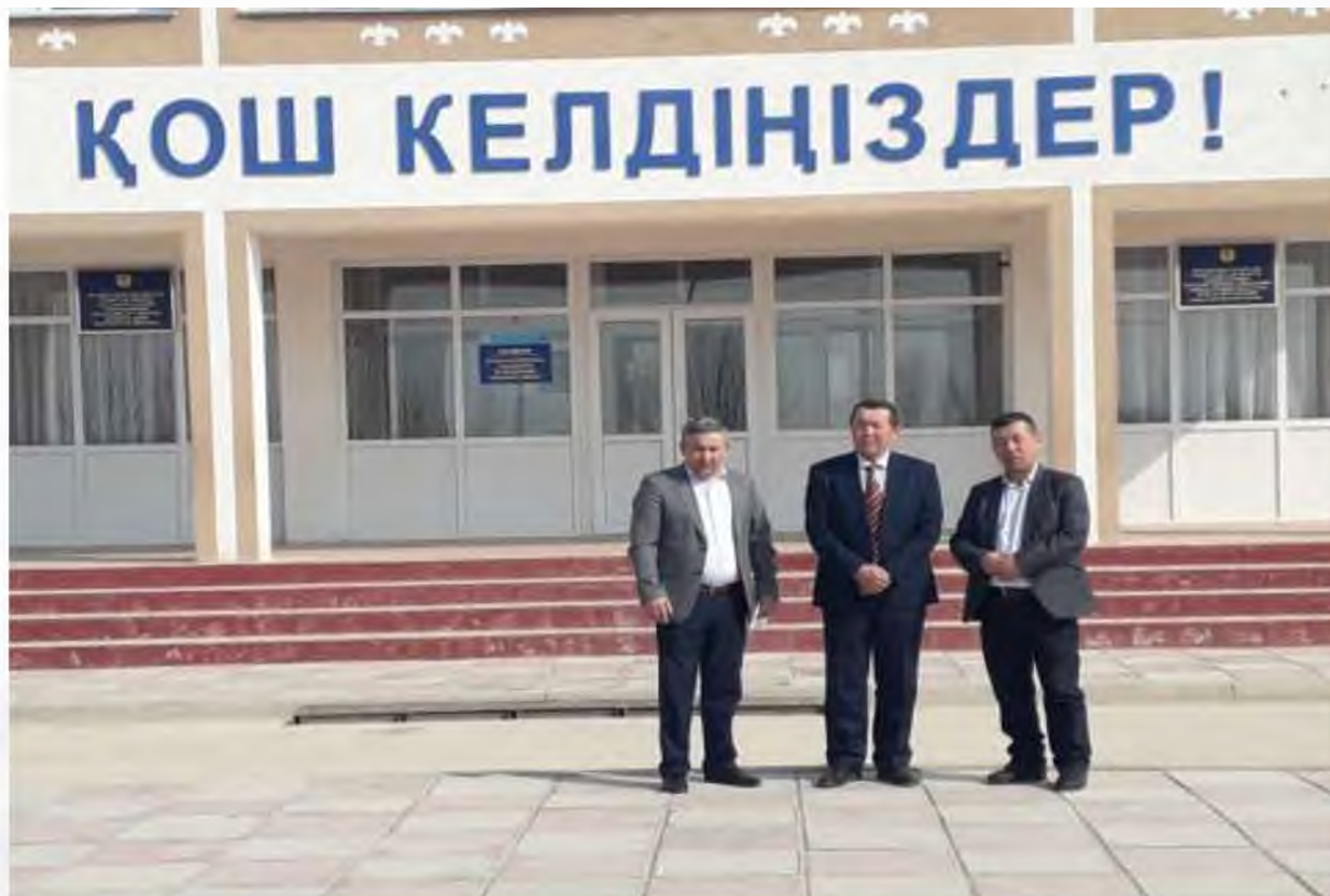
№9 жалпы орта мектебі