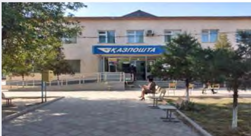
ЖЕТІСАЙ АУДАНЫНЫҢ ҚАЗПОШТА БӨЛІМІ