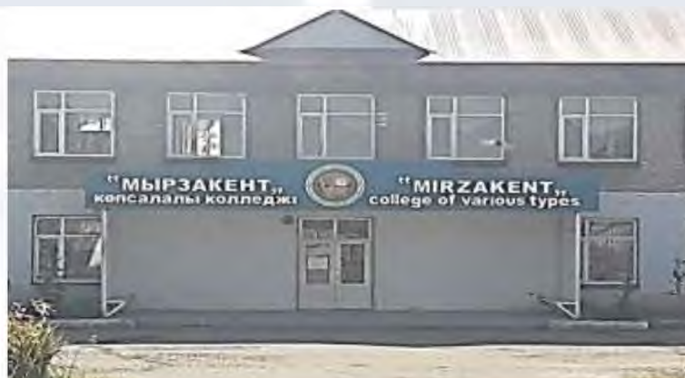
"МЫРЗАКЕНТ" КӨПСАЛАЛЫ КОЛЛЕДЖІ"