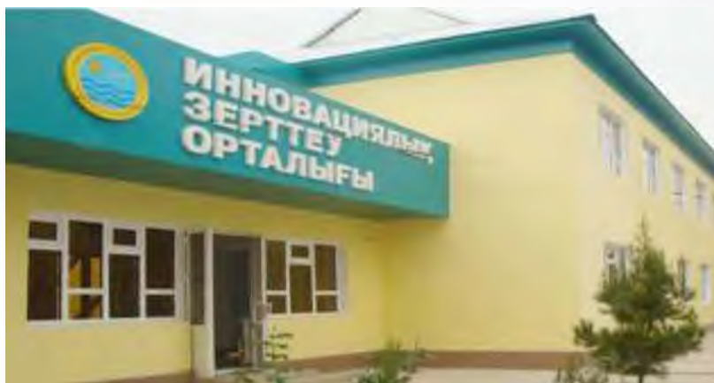
ИННОВАЦИЯЛЫҚ ЗЕРТТЕУ ОРТАЛЫҒЫ