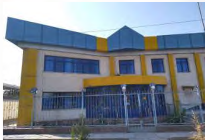
«ЭТАЛОН УСЛУГ» ЖАУАПКЕРШІЛІГІ ШЕКТЕУЛІ СЕРІКТЕСТІГІ