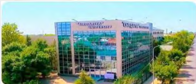
“СЫРДАРИЯ” УНИВЕРСИТЕТІНІҢ БАС ОҚУ ҒИМАРАТЫ