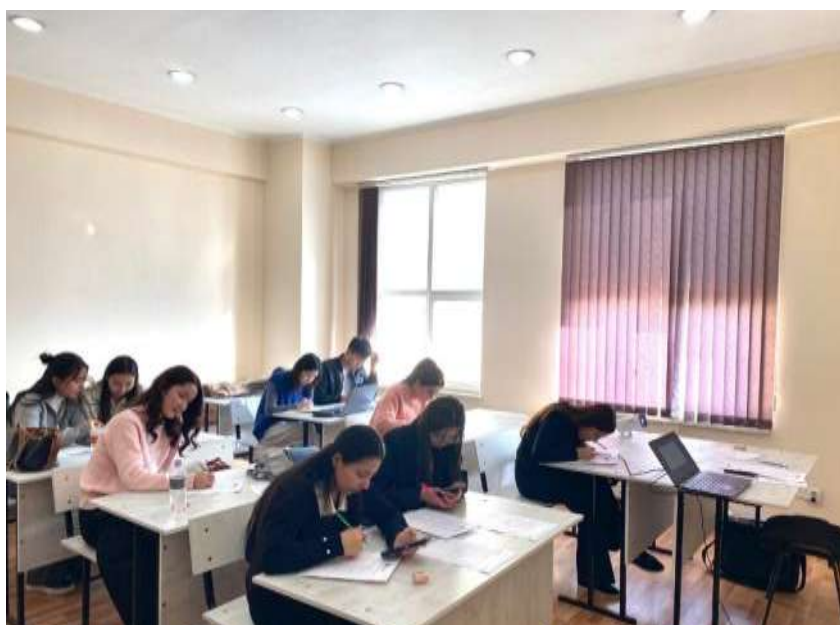
Фото: магистр, оқытушы Ізтілеуова А.Ж. ашық сабақ беру барысында

Фото: магистр, оқытушы Ізтілеуова А.Ж. ашық сабақ беру барысында https://www.instagram.com/p/DDOQHJSqRyM/?igsh=N3hxY2tlc2QzamMy